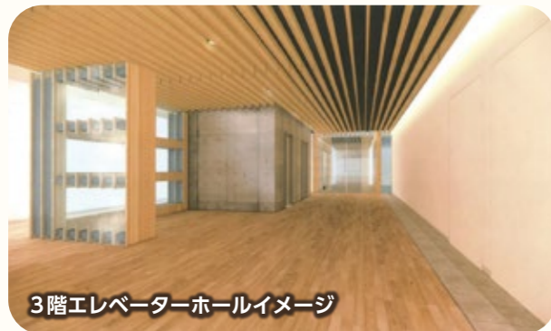
3階エレベーターホールイメージ

内装は可能な限り木材を使用し、来庁者を優しく迎え入れる温かみのあるデザインを採用します。