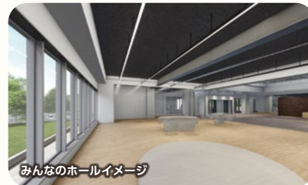
みんなのホールイメージ

傍聴席には子ども連れの方が傍聴できる「親子傍聴席」やスロープを設置し、バリアフリー・ユニバーサルデザインを徹底します。