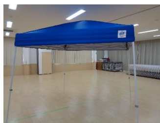
<イージーアップテント>