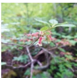
五葉山にしか咲かない ゴヨウザンヨウラク (6月下旬～7月上旬が見頃)