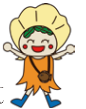
釜石市食育イメージキャラクター はたてちゃん

食事を1日3回、規則正しくとっていますか。 朝食を食べない、野菜をほとんど食べない、おやつを食べ過ぎるなど、食生活が乱れている状態が続くと栄養バランスが崩れ、体調を崩すきっかけに繋がります。 生涯にわたり、心も体も健康で質の高い生活を送るため栄養のバランスについて考えてみましょう。