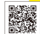
総合防災マップデータ版

問い合わせ 総合防災マップについて 市防災危機管理課 ☎ 27-8441 防災講座の開催について 市まちづくり課 生涯学習係 ☎ 27-8454