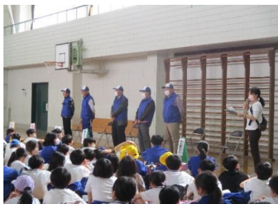
4月17日 集団下校指導(見守り隊との顔合わせ)

小佐野小学校では、交通安全のための取組みが、熱心に行われています。まず、4月11、12、15日の3日間に渡り交通安全教室が実施されました。4月16日には、今年度の交通安全少年団の結団式が行われ、翌17日には地域の見守り隊 (スクラム小佐野見守り隊) との初の交流の場 (集団下校指導) が設けられました。交通安全に対する意識を高めるために、いずれも意義のある場となりました。子供達には、学んだことを生かし、事故もなく楽しい学校生活を送って欲しいものです。