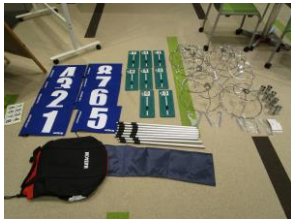
グラウンドゴルフセット