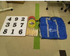
公式ワナゲセット