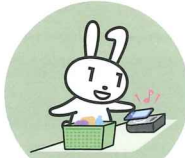
キャッシュレス 決済申込