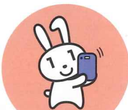
確定申告 (2024年度より)