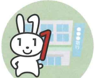
銀行・証券 口座開設