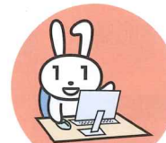
行政機関からの お知らせ・各種証明書