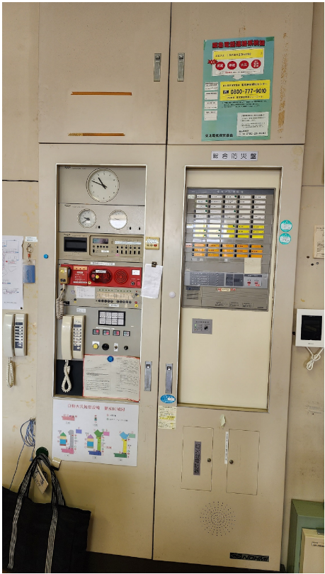
2階職員室 既存防災盤収納設備写真