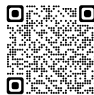
釜石市ウェブ版 ハザードマップ