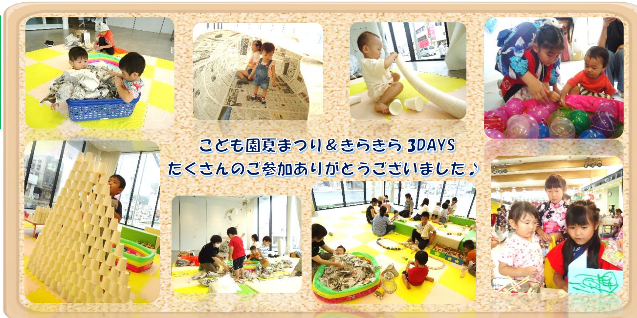
こども園夏まつり&きらきら3DAYS たくさんのご参加ありがとうございました!