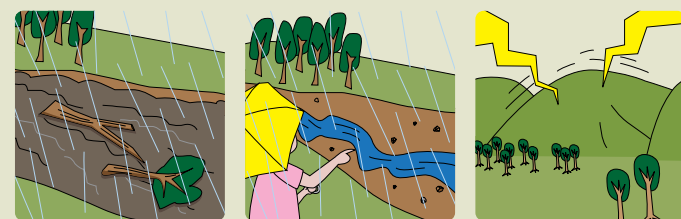
急に川の流れが濁り、流木が混ざっている 雨が降り続けているのに、川の水位が下がる 山鳴りがする