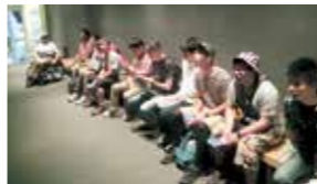
鉄の歴史館で予備知識を学ぶ参加者

現在までに「鉄」をテーマとしたツアーを2回開催し、参加者は延べ22人。ツアー内容は鉄の歴史館で予備知識を学んだ上で橋野高炉跡へ行き、ガイドの説明を聞きました。また、参加者が講師となり、教科書には載っていないような、より身近な鉄に関する豆知識を学びました。今後もさまざまなテーマでツアーを企画・運営していきますので、興味のある人はぜひ、Facebookページへ連絡をお願いします。