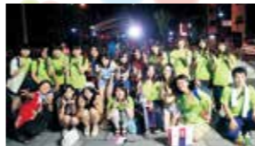
釜石よいざの運営に参加した高校生の皆さん