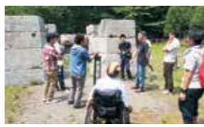
参加者も講師となり鉄に関する知識を深めました

釜石さあへの会問い合わせ: まち・ひと・しごと創生室 釜石市議会事務局(☎22-2111、内線132)