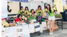
釜石よいざの運営を手伝いました

高校生が発案し、結成したチームです。地元と触れ合い、貢献できる高校生向けボランティア活動を企画・実施することで、大学生や社会人になる前に、地元をより深く知る場をつくることを目的に活動しています。釜石と大槌の高校生で構成し、放課後の時間を使って定期的に集まっています。現在までに「釜石よいざ」や釜石大観音仲見世で行われたイベントの運営に参加。メンバー以外の高校生にもボランティア活動の参加を勧め、一緒に楽しみながら活動を続けています。今後もまちに貢献できるボランティア活動を企画していきますので、興味のある高校生はぜひ、ご連絡ください。