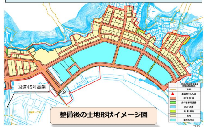
【別資料 36 ページ】

昨年住民の皆様にご回答いただいた意向調査結果に基づき、現在、宅地の割り込み検討を行っております。2015年6月より、対象となる地権者さまに割り込みを行った宅地の位置をご確認していただくために個別面談会を実施いたします。こちらにつきましては近日中に案内状を送付いたします。